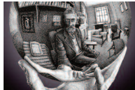
Maurits Cornelis Escher "Mano con sfera riflettente", 1935 (part.)