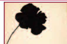
Kounellis: stile e linguaggio di un narratore contemporaneo

Jannis Kounellis, nasce in Grecia ma è legato all'Italia a doppio filo. Noto al grande pubblico come protagonista dell'Arte Povera, a venti anni, si stabilisce a Roma e completa gli studi all'Accademia delle Belle Arti. È il 1969 quando presenta a L'Attico di Roma Cavalli, un'opera che suscita reazioni controverse; nulla sembra esser cambiato, eppure tutto è mutato. Ben trentatré anni dopo è ancora presenza imprescindibile, rara e gentile e nelle sale de La Galleria Nazionale di Roma si ammira "Atto Unico": un labirinto di lamiera di ferro, pietre, "carboniere", "cotoniere", sacchi di iuta.