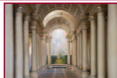
"Smarginare spazio, illuminare mutevolezza" l'architettura di Francesco Borromini

Gioca con il vuoto, lo plasma attraverso architetture magnifiche, dove piega i materiali a seguire il suo ingegno di artista e la sua visione senza requie.